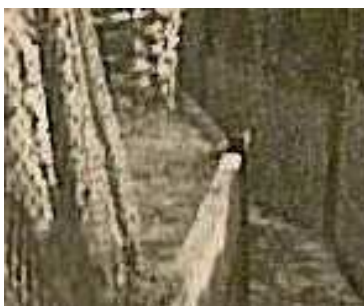
Obr. 5/1: Střelecký stupeň