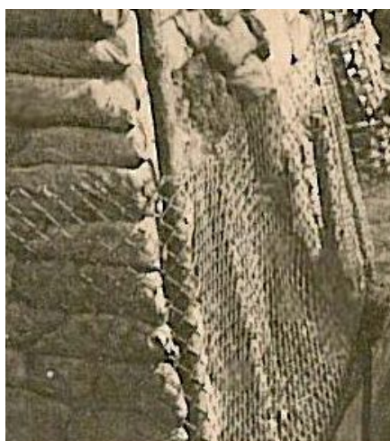
Obr. 5/4: Stěny traverzy zpevněné pomocí pytlů s horninou, kúlů a drátěného pletiva