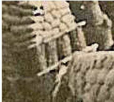
Obr. 5/6: Gabiony podloženy dřevěnými trámy (nebo kulatinou)