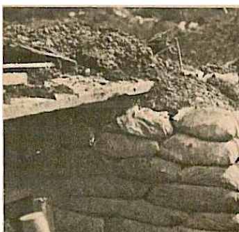
Obr. 5/5: Nakrytý vchod do úkrytu nebo pozorovatelný