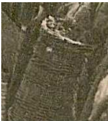
Obr. 5/3: Proutěný fabion