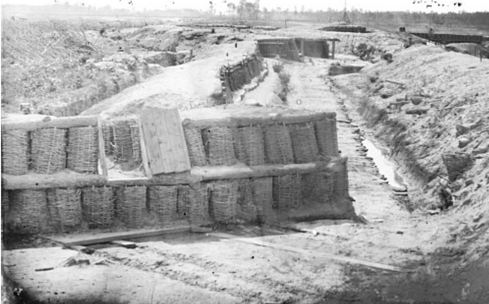
Obr. 5/7: Použití gabionů na opevněních z období americké občanské války. Gabiony jsou podloženy dřevěnými trámy.