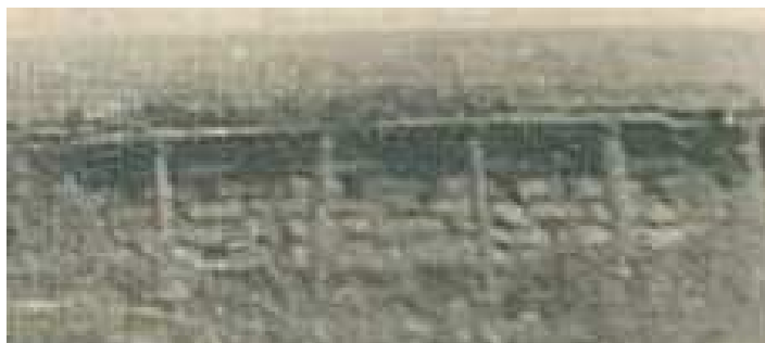
Obr. 1/2: Nakrytý střelecký zákop