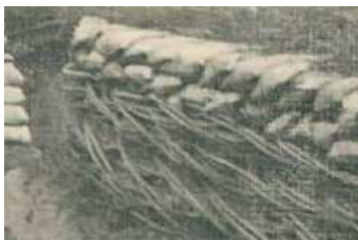
Obr. 1/1: Zajímavý způsob zpevnění stěny proutím